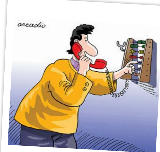
انری از: arcadiosquive

چرخه شلختگی و افسردگی، دو طرفه است؛ یعنی نه تنها افسردگی می تواند منجر به شلختگی نوجوانان شود، بلکه شلختگی نیز می تواند افسردگی به همراه داشته باشد. شلختگی اطراف نوجوانان، می تواند برای آن ها استرس زا باشد و موجب بروز احساسات منفی در آن ها شود. بهتر است بدانید که نه فقط شلختگی خود نوجوان، بلکه اوضاع کل خانه و بی نظمی خانواده نیز می تواند گاهی اوقات نوجوان را بیشتر در معرض خطر افسردگی قرار دهد.