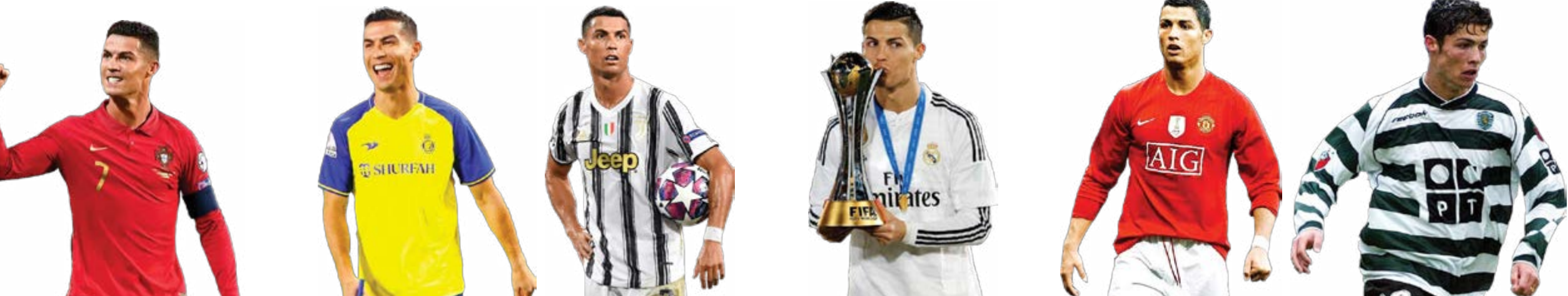
شروع داستان اسپورتینگ با ۵ گل

کریس که روزگاری در فقر و تنگدستی بزرگ شده بود و با خوردن باقی مانده ساندویچ دیگران دوام آورد تا رویاهايش را محقق کند در ۱۷ سالگی به تیم اول اسپورتینگ لیسبون پرتغال پیوست. او از معدود ستاره‌های پرتغالی است که برای یورو ۲۰۰۴ بازی نکرده اما شهرت جهانی از روی پناهنگی با میرزاپور زد. در رده ملی شاید اگر در کشور دیگری بود قهرمانی جام جهانی را هم به فهرست افتخاراتش اضافه کرده بود اما تیم ملی پرتغال طی سال‌های طولانی حضور او فقط موفق شده یک بار قهرمانی یورو ۲۰۱۶ را کسب کند. پرتغال با کریس اولین دوره لیگ ملت‌های اروپا در سال ۲۰۱۸ را هم کسب کرد اما قطعاً افتخارات ملی برای کریس که در افتخارات فردی و باشگاهی موفقیت دارد و تمام تلاشش را برای بهترین بودن انجام می‌دهد برای همین بعد از کسب کلی افتخار باشگاهی، ملی و فردی، وقتی با النصر از لیگ قهرمانان آسیا حذف شد مثل یک بازیکن جوان و پرتالانگیز که شانس مهمی را در زندگی دست داده است، بی‌امان گریه کرد.