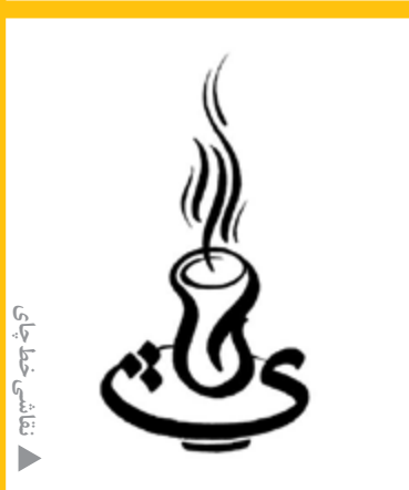
نقاشی خطی جای