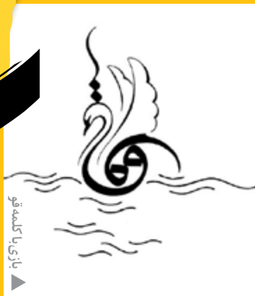
نقاشی با کلمه قو