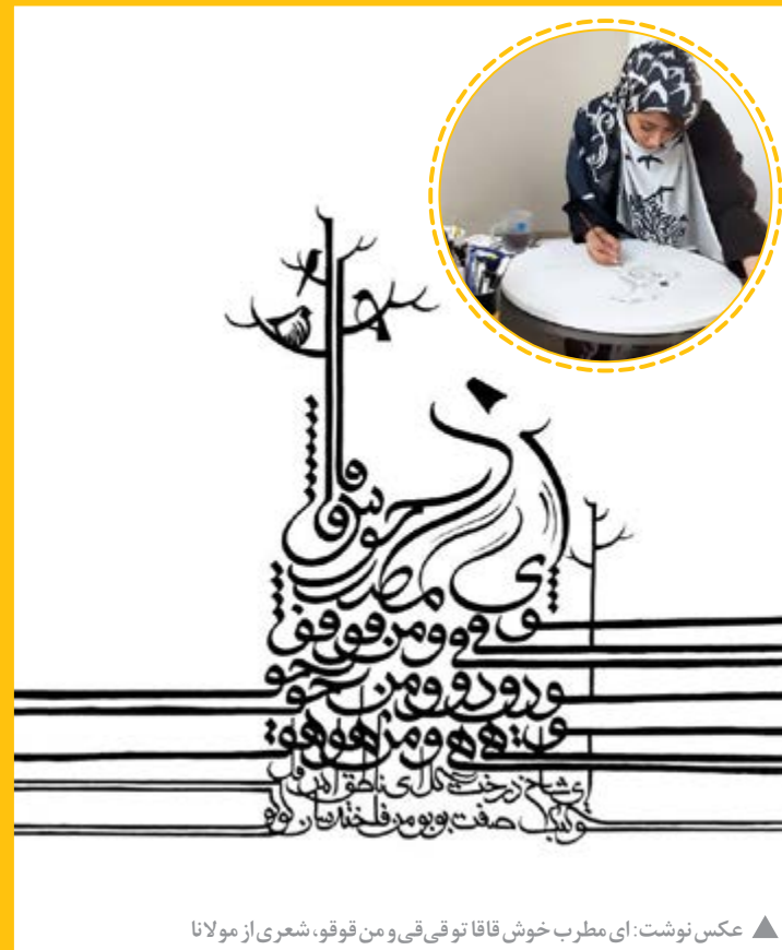
عکس نوشت: ای مطرب خوش قافا تو قی قی و من قو قو، شعری از مولانا