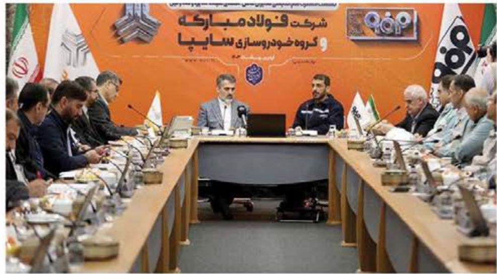
مدیرعامل شرکت فولاد مبارکه مطرح کرد:

وی تصریح کرد: بر اساس هدف گذاری سال ۱۴۱۰ درآمد سه ساله فولاد مبارکه بالغ بر ۱۵ میلیارد دلار تعریف شده است.