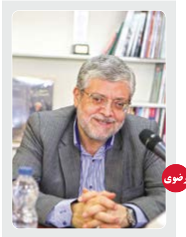
شهردار مشهد با حضور در «خراسان» مطرح کرد: ضرورت نگاه ویژه دولت به مشهد

گزارشی از افزایش قیمت رهن و اجاره واحدهای تجاری در مشهد بلیشو در تعیین اجاره املاک تجاری خراسان رضوی استقلال گران ترین تیم اورونوف ارزشمندترین بازیکن گران ترین های لیگ در انحصار ۴ تیم! حکم عاملان «جنایت رگباری» صادر شد ۳ بار اعدام برای قاتل فراری! یادداشت روز مصطفی منتظر به آقای پزشکيان حق و فرصت دهید! پس از چند هفته اجرای فرایندهای کمیتهای برای معرفی نامزدهای وزارتخانههای ... ← صفحه ۲