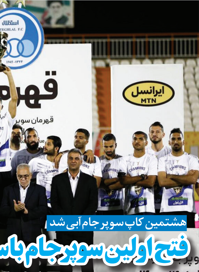
هشتمین کاپ سوپر جام آبی شد

ورزشگاه شهید سردار سلیمانی کرمان میزبان سوپر جام معوقه ایران بود،