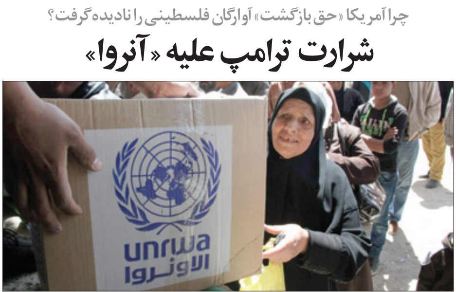
عمران خان، نخست‌وزیر پاکستان، در جریان یک دیدار با خبرنگاران در دفتر خود در اسلام‌آباد.

ویس از آن در جریان جنگ دوم در سال ۱۹۶۷ حداقل ۳۵۰ هزار نفر از آن مجبور به ترک خانه‌های خود شدند. هم‌اکنون تعداد کل پناهجویان فلسطینی بیش از پنج میلیون نفر اعلام شده است. این پناهجویان طی هفت دهه گذشته علاوه بر نوار غزه و کرانه باختری رود اردن، در اردوگاه‌های سه کشور دیگر شامل اردن، لبنان، و سوریه زندگی کرده‌اند و حتی نسلی از این افراد در همین اردوگاه‌ها به دنیا آمده و مرده‌اند. در عین حال اردن با داشتن بیش از دو میلیون پناهجو بزرگ ترین اردوگاه فلسطینی‌های رانده شده از خانه‌های خود به شمار می‌رود. همچنین دیگر کشورهای عربی از جمله تونس، مصر، عراق و… نیز میزبان بخش دیگری از پناهجویان فلسطینی هستند. مشترک همه این پناهجویان علاوه بر فلسطینی بودن، یک چالش بزرگ به نام بی تابعیتی است. در واقع پناهجویان فلسطینی که از سال ۱۹۴۸ به بعد مجبور به ترک خانه‌های خود و استقرار در اردوگاه‌های خارجی شده‌اند، هنوز هیچ تابعیت رسمی ندارند. همین موضوع به چالش‌های بزرگ دیگری از جمله محدودیت کار و رفت و آمد در کشورهای میزبان و همچنین مشکلات بعدی از جمله بالاکلفی کودکانی منجر شده که اردوگاه‌ها به دنیا آمده‌اند. این چالش‌ها تا به امروز برای پناهجویان فلسطینی در همه جای