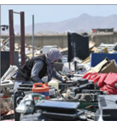
خانیانی که آمریکایی ها در بگرام به جا گذاشتند

فرماندهی مرکزی ارتش آمریکا با صدور بیانییه ای گفت که سه نظامی آمریکایی در کویت کشته و زخمی شدند. تاکنون هیچ دلیلی در خصوص مرگ نظامیان آمریکایی در قطر رسانه ای نشده است. با این حال به نوشته اسپوتنیک، براساس اطلاعات کانال تلگرامی WarGonzo، ویلیس در فهرست افرادی که در ترور شهید سلیمانی شرکت داشتند، وارد شده بود. در عین حال هیچ منبع معتبری ادعای این کانال تلگرامی را تایید نکرده است. در عملیات ترور سردار شهید سلیمانی، از پایگاه العدید ایالات متحده در قطر نیز استفاده گسترده ای شد.