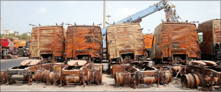
بخشی از ماشین‌های سنگینی که در انبار گمرک بوشهر به‌هن قراضه تبدیل شدند!

حد اقل فقط ۵۰ درصد از پست‌های سازمانی با تصدی، در شهرستان‌های تازه تأسیس شکل گرفته باشند، بار مالی برای پرداخت هزینه‌های پرسنلی ۴۰ شهرستان جدید شکل گرفته، با توجه به هزینه‌های سال ۱۴۰۰، برای یک سال حدود ۱۲ همت بوده است. البته این رقم بدون احتساب هزینه‌های پرسنلی مربوط به نهادهای نظامی، انتظامی و اطلاعاتی، داد گستر ی، شهرداری‌ها، مجموعه وزارت نفت و شرکت‌های تابعه و سازمان تأمین اجتماعی و همچنین بار مالی ناشی از امکانات، زیر ساخت‌ها، آبپیه و تجهیزات مورد نیاز برای استقرار دستگاه‌های دولتی (اعتبارات تملک دارایی‌های سرمایه ای) است. وی در پایان تاکید کرد: با توجه به پیامدهای منفی تبدیل کشور به واحدهای کوچک سیاسی، ضروری است در برنامه هفتم توسعه، بر ارائه لایحه جامع تقسیمات کشوری توسط وزارت کشور، با رویکردی جدید به منظور ایجاد ثبات در نظام تقسیمات کشوری، ممانعت از ایجاد واحدهای سیاسی ناکارآمد و کوچک، تسریع روند توسعه متوازن در سطح منطقه‌ای و ناحیه‌ای و ابغای نقش دولت‌های محلی در توسعه پایدار تاکید شود.