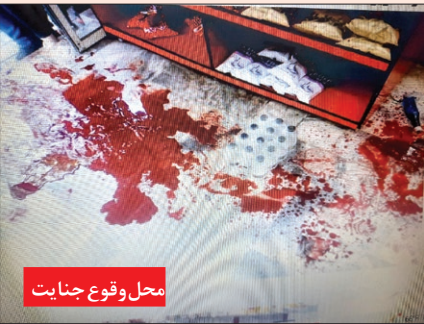
محل وقوع جنایت

۲۳ ساله، چاقویی را بیرون آورده و مهاجم را زخمی کرده است. این گونه بود که بی درنگ قاضی صفری دستور داد تا مشخصات قاتل به همه مراکز درمانی گزارش شود چرا