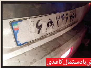
تصویری از پلاک مخدوش با دستمال کاغذی

پرداخت. در این هنگام که خودروی تحت تعقیب وارد بزرگراه صدمتری شده بود، نیروهای انتظامی به ناچار لاستیک های پراید ۱۱۱ را هدف قرار دادند و چند گلوله شلیک کردند. این تیرباران ها در حالی شدت گرفت که مرد جوان سر نشین جلوی پراید زیر رگبار گلوله های پلیس در حال استعمال کریستال بود تا از خماری نجات