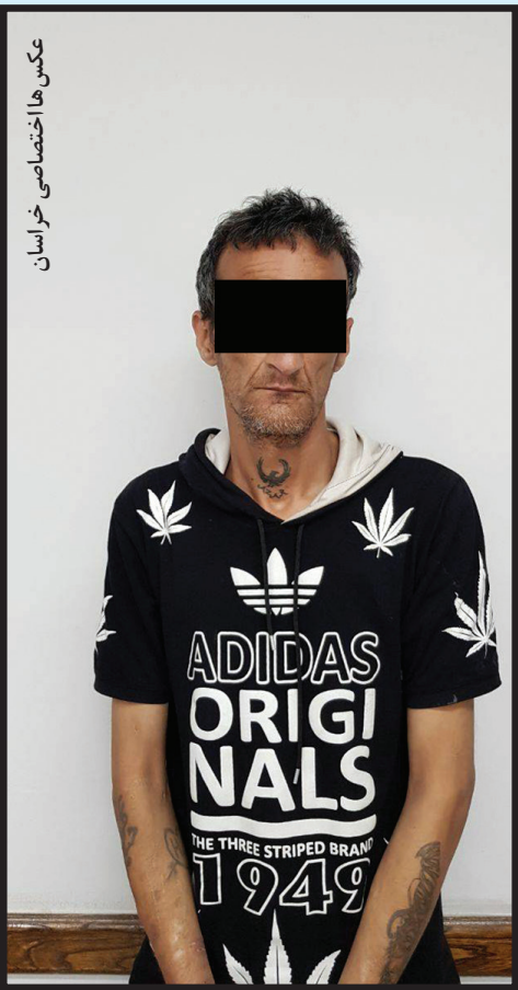
عکس ها اختصاصی خراسان

دست آمد و صبح روز گذشته کارآگاهان در یک عملیات ضربتی و هماهنگ وارد این مسافرپذیر شخصی در بولوار وحدت شدند و حلقه های قانون را بر دستان هر دو نفر بستند. به گزارش روزنامه خراسان، بررسی های قدمداتی نشان داد که زن معتاد نقشی در جنایت ندارد بنابراین وی با صدور قرار قانونی آزاد شد و مرد ۴۸ ساله به شعبه ویژه جنایی دادسرا انتقال یافت. وی که روز گذشته در برابر میز عدالت ایستاده بود ابتدا سعی کرد خود را بی خبر از ماجرای جنایت در مسافرپذیر شخصی نشان دهد به همین دلیل مدعی بود که مقتول را نمی شناسد، اما وقتی به تماشای صحنه هایی از جنایت خود نشست که روی صفحه نمایشگر نقش بست دیگر نتوانست حقیقت را کتمان کند. در این حال وی با خونسردی کم نظیری به رمزگشایی از این معمای جنایی پرداخت و گفت: من و آن جوان از سال ها قبل دوست بودیم ولی او (مقتول) همه اموال مرا صاحب شده بود و به من هم جوابی نمی داد. پول خرید خودروی پژویی را که او سوار می شد، من پرداخت کرده بودم. از طرف دیگر منم از راه او اجاره داده بودم اما آن را تخلیه نمی کرد. روز حادثه وقتی به همراه همسر صیغه ای ام به مسافر خانه شخصی رفتم با او جر و بحث کردم که ناگهان چاقو کشید و من هم با سنگی که پشت در اتاق بود ضربه ای به سرش زدم