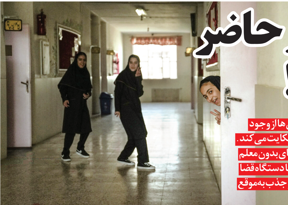
روز اول مدرسه

درباره تعداد کمبود معلم، آمار های متفاوتی وجود دارد. همچون گفته چندی قبل حاجی بابایی