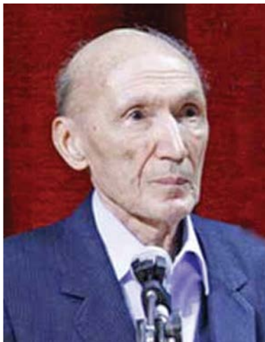
دکتر جیمز سیمیسون

شاید بهتر باشد صحبت‌مان در باره تاریخ بیهوشی را با اطلاعاتی در باره ایران معاصر تمام کنیم. جالب است بدانید که نخستین عمل جراحی با استفاده از شیوه‌های بیهوشی مدرن در ایران، سال ۱۲۳۰ خورشیدی و در شهر تهران انجام شد و در آن، «یاکوب ادوارد پولاک»، پزشک مخصوص ناصرالدین شاه و اهل اتریش، شخصی را با استفاده از اتر بیهوش کرد تا روی عمل جراحی انجام دهد. شیوه استفاده از اتر در ایران، با این عمل جراحی جا افتاد و تا سال‌ها، بیهوش کردن بیماران با استفاده از روش استنشاقی به‌کار گرفتن اتر انجام می‌شد. بعدها، شیوه بی‌حسی نخاعی هم مورد استفاده قرار گرفت، اما به عمل بیهوشی در بیمارستان‌ها، به صورت تخصصی توجه نمی‌شد. تا این که در سال ۱۳۳۰ ش، یک متخصص بیهوشی فرانسوی به نام «بوته» دعوت دکتر یحیی عدل از به تهران آمد و به دنبال آن، بیهوشی شکل و شمایل یک تخصص ویژه به‌خود گرفت. یک سال بعد از آمدن بوته به ایران، «علی فر» به عنوان اولین متخصص بیهوشی ایران، از انگلیس بازگشت و به عنوان استاد در دانشکده پزشکی دانشگاه تهران به تدریس پرداخت. به این ترتیب، دانش بیهوشی در کشور ما به عنوان علمی خاص و مستقل مورد توجه قرار گرفت. نخستین افراد فعال در این رشته، به جز متخصصانی که نام بردیم، کسانی مانند محمد اسماعیل تشدید و عبدا... مرضوی بودند.