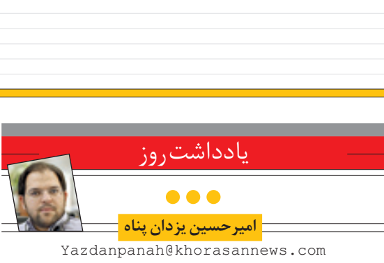
امیر حسین یزدان پناه