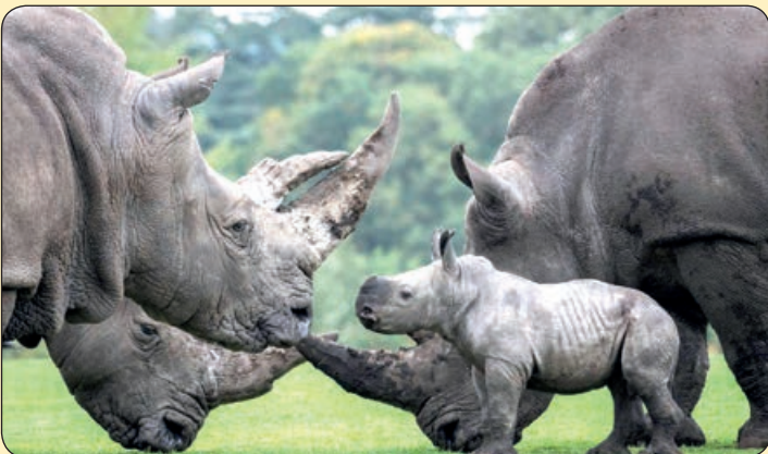
کارترز نیوز | اولین ملاقات بچه‌تاز همتولد شده کرگدن با اعضای خانواده‌اش، پارک‌سafari، انگلستان