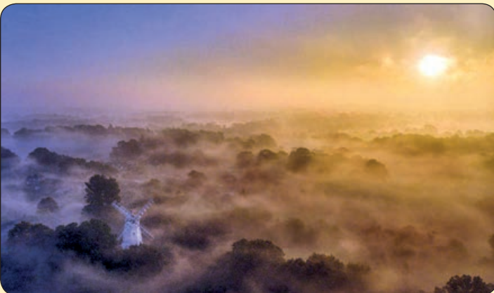
تلگراف| آسیاب بادی در مِه صبحگاهی