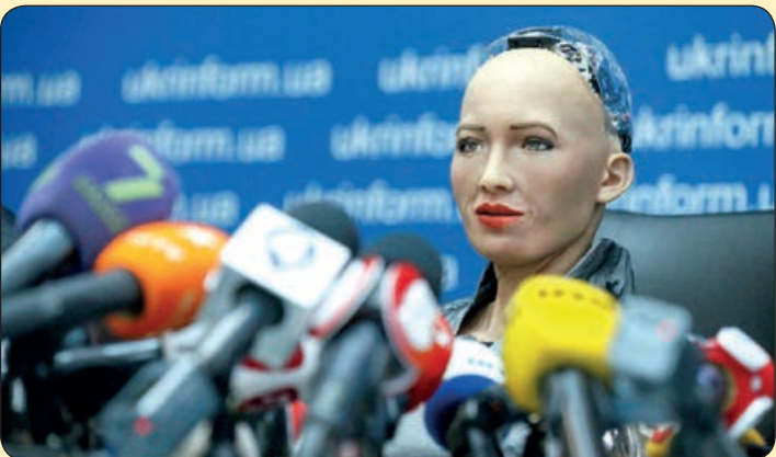
نشست خبری روپات انسان نما «سوفیا»، اوکراین