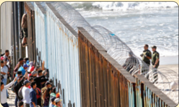
مهاجران در مرز آمریکا و مکزیک

بگذار از صدای گذر آب و پرنده هایی که می خوانند و برگ هایی که در باد می رقصند لذت ببرم... بگذار تا به اندازه تمام لذت های جهان از صدای نم نم باران و عطر چمن های خسیسی که در آن قدم برمی دارم لذت ببرم