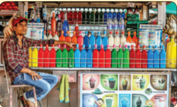
مغازه داری که شربت سنتی می فروشد، هندوستان