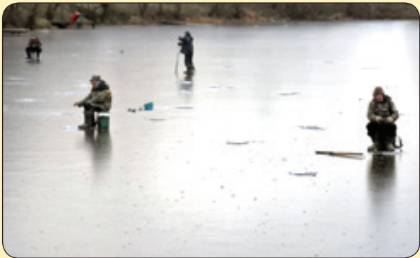
ماهی گیری روی رودخانه یخ زدده، روسیه