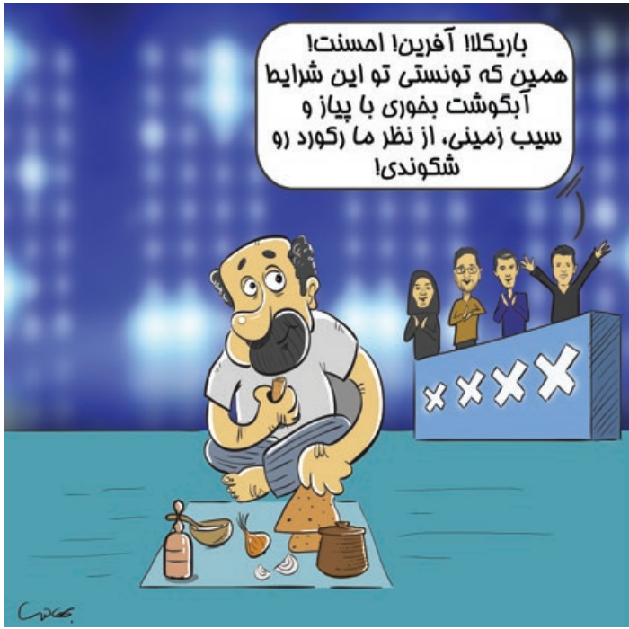
کار نویسند: محمد بهادری

در حاشیه ادعاهای بعضی شرکت کنندگان «عصر جدید» درباره ثبت جهانی رکوردهایشان!